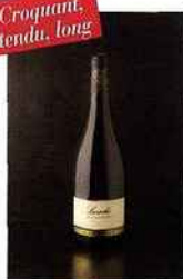
Laroche Bourgogne, bourgogne 2014 blanc