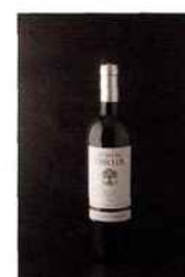
Château Trillo, La Dame d'Argent, corbières 2014 blanc