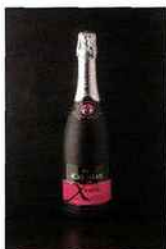
Ackerman, X Noir, brut rosé