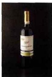
Bodegas Bocopa, Don Mantillon Barrica, DO Alicante 2015 rouge