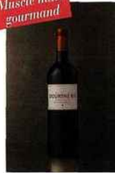
Dourthe, Dourthe N°1, bordeaux 2014 rouge 9,90 euros