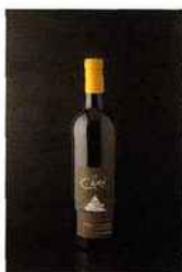
Domaine Cottebrune, Le Cairn, faugères 2014 blanc