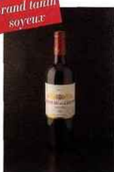
Château de Cérons, graves 2014 rouge