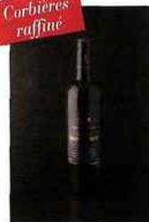
Château du Grand Caumont, Cuvée Spéciale, corbières 2014 rouge