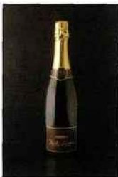
Caves Bailly Lapierre, Ravizotte, crémant de Bourgogne blanc 9,90 euros