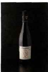
Vignerons du Mont Ventoux, Viognier, IGP méditerranée 2015 blanc