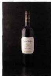
Château Labégorce, Zédé de Labégorce, margaux 2012 rouge 15 euros