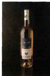
Domaine Le Loup Bleu, Croix du Sud, côtes-de-provence Sainte-Victoire 2015 rosé 11 euros