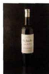
Les Jamelles, Sélection Spéciale cabernet-merlot, IGP pays-d'oc 2014 rouge