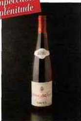
Château d'Aqueria, tavel 2015 rosé 11 euros