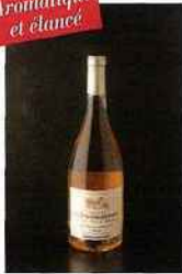
Château La Sauvageonne, cuvée Pica Broca, languedoc 2015 rosé 9,90 euros