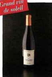
Dauvergne Ranvier, Vin Rare, côtes-du-rhône 2013 rouge