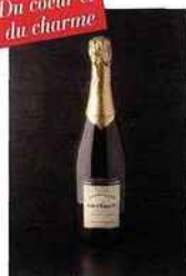
Champagne Vauversin, Original, blanc de blancs 18,20 euros