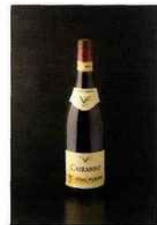
Vidal-Fleury, côtes-du-rhône villages Cairanne 2012 rouge 10,90 euros