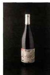
Les Vignerons du Vallon, Les Cayla, marcillac 2015 rouge