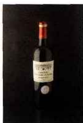
Château Fougère La Noble, bordeaux 2014 rouge