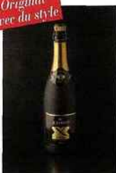
Ackerman, X Gold Ackerman, brut blanc