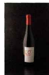
Domaine du Joncier, L'O de Joncier, côtes-du-rhône 2014 rouge