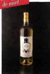
Château de Malle, Sainte-Hélène, sauternes 2011 blanc 15 euros