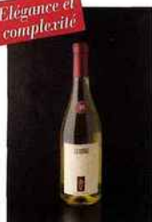
Colle Di Bugano, Le Cèdre, Colli Berici DOC 2014 blanc