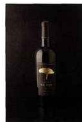
Les Vignerons de Tutiac, lieu-dit Le Pin, blaye-côtes- de-bordeaux 2012 rouge