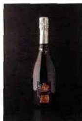
Champagne Leconte Xavier, Le Charme d'Anais, brut 2010 19,50 euros