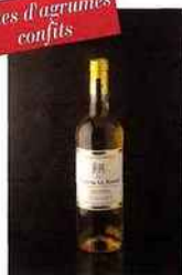
Château La Bouade, cuvée Vieilles Vignes, sauternes 2013 blanc