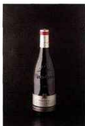
Domaine Jaume, Référence, vinsobres 2013 rouge