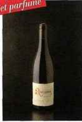
Domaine La Réméjeanne, Les Arbousiers, côtes- du-rhône 2015 blanc 9,50 euros