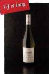
Caves de Pouilly Sur Loire, Les Moulins à Vent, pouilly-fumé 2015