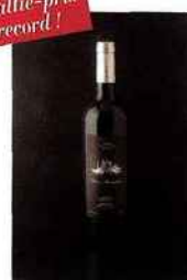
Bodegas Bocopa, Don Mantillon Crianza, DO Alicante 2012 rouge