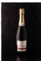
Champagne J. De Telmont, Grande Réserve brut 25 euros