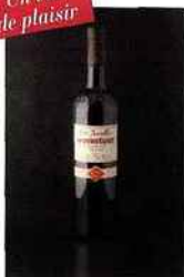
Les Javelles - Mourvèdre, IGP pays-d'oc 2015 rouge