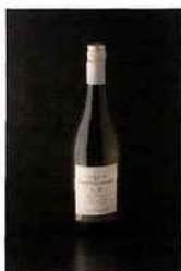
Domaine Saint-Lannes, Gros-Manseng, IGP côtes- de-gascogne 2015 blanc