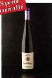
Domaine viticole de la ville de Colmar, Clos Saint-Jacques Pinot Gris, alsace 2014 blanc