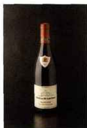
Château de Santenay, Pinot Noir - Vieilles Vignes, bourgogne 2014 rouge