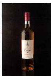
Les Grands Chais de France, Mademoiselle Comédie, bordeaux 2015 rosé