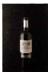
Château de Fontenille, entre-deux-mers 2015