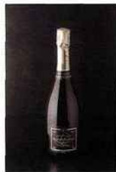
Champagne Brisson-Lahaye, blanc de noirs brut 15,80 euros