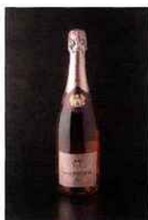
Champagne Pascal Walczak, brut rosé 16,25 euros