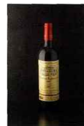
Château Labrousse, blaye-côtes-de-bordeaux 2015 rouge