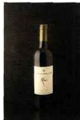
Château Malavieille, Alliance, terrasses-du-larzac 2013 rouge 10,10 euros