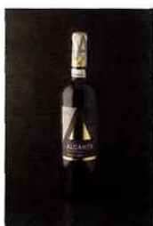
Bodegas Bocopa, Alcanta Crianza, DO Alicante 2012 rouge