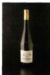
Château de l'Hyvernière, muscadet- sèvre-et-maine 2015 blanc