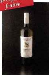
Domaine du Tariquet, Premières Grives, IGP côtes-de-gascogne 2015 blanc