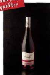
Vignerons Ardéchois, Orélie, IGP ardèche 2015 rosé