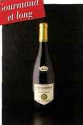
Caves Bailly Lapiere, saint-bris 2014 blanc