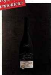
Cellier des Dauphins, Signature, côtes-du-rhône 2015 rouge