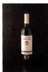
Château Trillo, cuvée Dolmen, corbières 2012 rouge