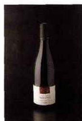
Domaine Theulot Juillot, lieu-dit Les Chenaults, mercurey 2014 blanc