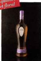
Les Grands Chais de France, IGP aude La côte-révée 2015 rosé