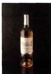
Château de Marsan, bordeaux 2015 rosé