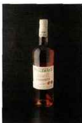
Domaine de Pellehaut, L'Été Gascon, IGP côtes- de-gascogne 2015 rosé