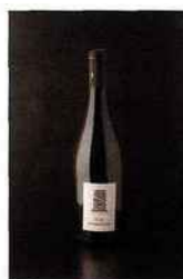
Clos des Orfeuilles, muscadet-sèvre-et-maine 2015 blanc