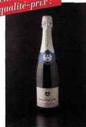
Champagne Pascal Walczak, cuvée Extra-Brut 16 euros