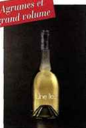
Domaine Terra Vecchia, Une Île, IGP île-de-beauté 2015 blanc