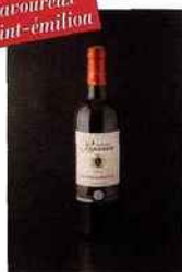
Château Piganeau, saint- émilion grand cru 2011 rouge