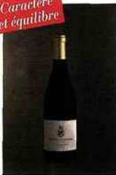
Le Hameau Des Ollieux, Les Aspres, corbières- boutenac 2014 rouge 10 euros