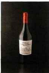
Château La Rousselière, saint-estèphe 2012 rouge 11 euros