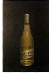
Canet-Valette, Une et Mille nuits, vin sans IG 2015 blanc 9,50 euros