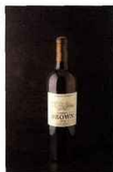
Château Brown, La Pommeraie de Brown, pessac-léognan 2014 blanc