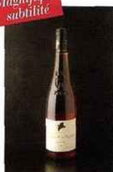
Domaine de la Mordorée, La Dame Rousse, tavel 2015 rosé