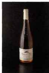
Château la Varière, cabernet-d'anjou 2015 rosé