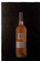
Les Vignerons de la Méditerranée, Fraïcheur du Sud, IGP pays-d'oc 2015 rosé