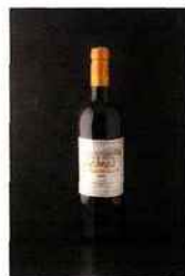
Château La Roche Bazin, blaye- côtes-de-bordeaux 2014 rouge