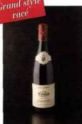
Perrin & Fils, Peyre Blanche, cairanne 2013 rouge