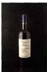
Domaine des Garennes, minervois-la-livinière 2014 rouge