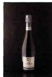
Champagne Dom Caudron, Prédiction 19,90 euros