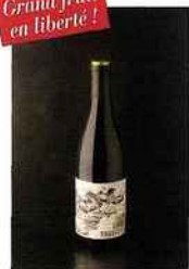
Domaine Gayda, Figure Libre Freestyle, IGP pays- d'oc 2014 blanc 11 euros