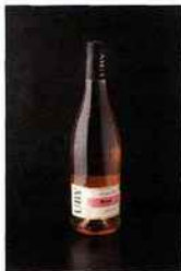
Domaine Uby, Uby Rosé N°6, IGP côtes-de-gascogne 2015