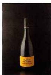
Château de Fleys, Les Fourneaux, chablis 1er cru 2014 blanc