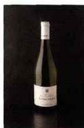
Domaine La Barbotaine - Frédéric Champault, sancerre 2015 blanc