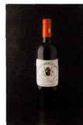
Château Fourcas Hostens, listrac-médoc 2010 rouge