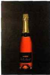
Caves Bailly Lapierre, Baigoule, crémant de Bourgogne rosé 9,90 euros