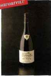
Château de Pizay, Les Sybarites, morgon 2014 rouge 9,50 euros