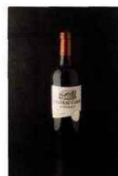
Château Cabos, bordeaux 2014 rouge