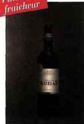
Château Auzias, Domaine Auzias, IGP cité-de- carcassonne 2015 rouge