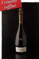
Arthur Metz, cuvée spéciale 1904, crémant d'Alsace blanc