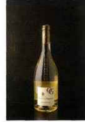
Domaine Orenga de Gaffory, patrimoine 2015 blanc 9,80 euros