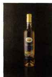
Château Bouscassé, Vendemiaire, pacherenc-du-vic-bilh 2009 blanc