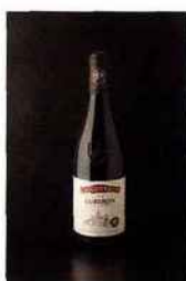
Amédée, L'Aiguebrun, luberon 2015 rouge