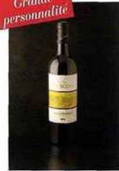
Château Bouscassé, Jardins, pacherenc-du- vic-bilh sec 2012 blanc 9,90 euros