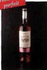
Les Vignobles Terrassous, La Réserve, côtes-du- roussillon 2015 rosé