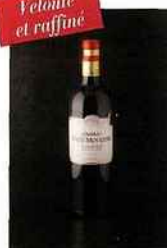
Château Haut-Mouleyre, bordeaux 2014 rouge